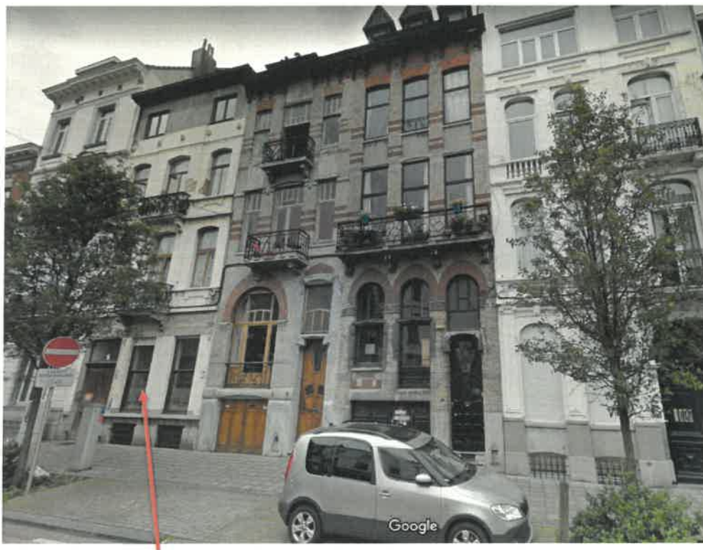
Le n° 16 de l'avenue Ducpétiaux et ses voisins classés

L'immeuble se situe dans la zone de protection de l'ensemble classé (AG du 06/07/2006) sis aux n os 18 et 20 de l'avenue et composé de deux maisons d'inspiration Art Nouveau réalisées par l'architecte A. Van Waesberghe en 1898. De plus, cette zone est reprise dans le RCUZ « Quartier de l'Hôtel de Ville » couvrant une partie du cœur de Saint-Gilles.