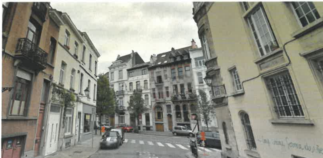
Vue depuis la rue du Portugal