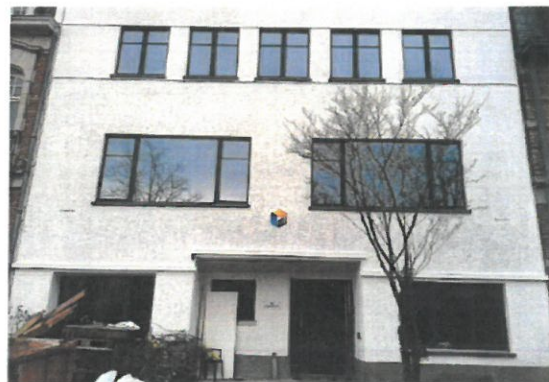
Façade après travaux, © CRMS, février 2019