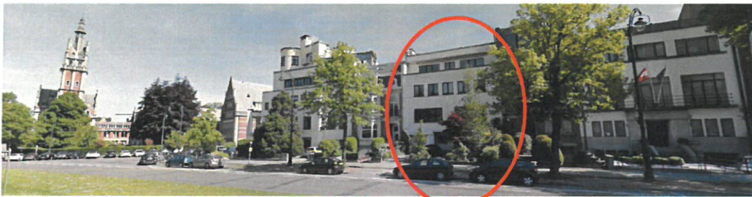
Façade avant travaux

En préalable, la CRMS signale qu'elle est invitée à se prononcer sur des travaux qui sont en voie d'achèvement, comme a pu le constater le membre de la Commission lors de sa visite des lieux du 15 février dernier. Elle ne souscrit pas à ce procédé du fait accompli qui est contraire à la réglementation.