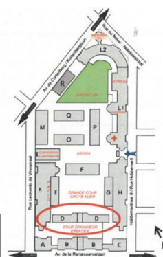
Ci-contre : Plan de l'École Royale Militaire avec en rouge le bâtiment D, l'objet de la présente demande

L'ensemble a été conçu par l'architecte Henri Van Dievoet, attaché au service technique du Génie. Les bâtiments ont été réalisés entre 1908 et 1913 selon les plans de l'architecte Henri Maquet. Le bâtiment faisant l'objet de la demande est le bâtiment D. Il est situé dans l'enceinte de l'École Royale Militaire entre la Cour d'Honneur et la Grande Cour.