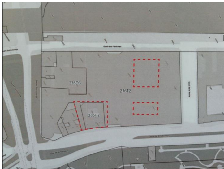
Localisation des 3 zones de démolition © plan joint au Rapport d'Incidences