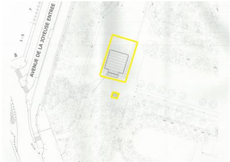
Plan de localisation sur le site des installations provisoires, en jaune. Image tirée du dossier

En attendant la mise en œuvre d'un tel plan de gestion pour les demandes futures, la CRMS rend un avis favorable pour la prochaine édition 2020 uniquement sous les conditions suivantes :