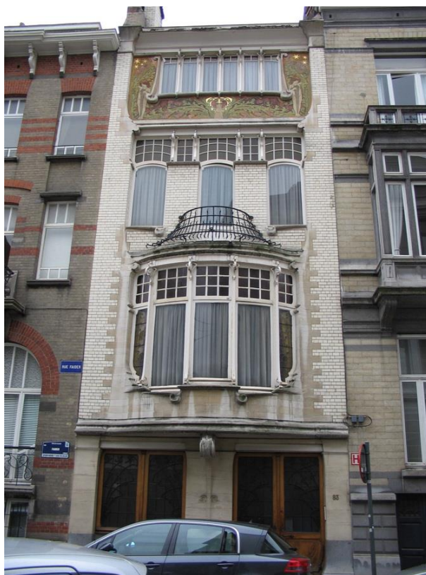
Rue Faider, 83, état en 2005