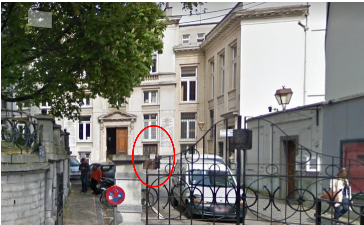
Entrée au pavillon Malibran via l'impasse de la chaussée d'Ixelles. On peut y voir une double porte secondaire, de plain-pied avec l'impasse, à droite de l'entrée principale d'accès au pavillon

Elle a également évalué d'autres possibilités d'accès dont une sans doute plus conséquente à mettre en œuvre que la solution envisagée par la commune mais plus respectueuse du patrimoine à savoir l'installation d'un petit ascenseur dans un local technique situé à côté de l'entrée côté chaussée d'Ixelles et de plain-pied avec le trottoir, donnant accès à la salle des pas perdus du pavillon Malibran et pouvant même être maintenu au-delà du chantier de l'îlot communal (car permettant dans le futur un accès direct au pavillon sans devoir traverser tout le complexe administratif).