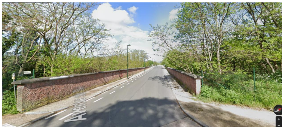
Pont 1 : avenue des Tilleuls (au croisement avec la rue du Kriekenput) : pont-arche enjambant la voie de raccord L26/5 A (voir dossier photos 12 à 16)

Les ponts concernés se situent successivement :