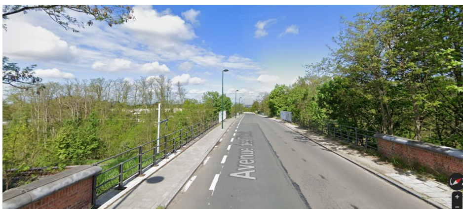
Pont 2 : avenue des Tilleuls : pont-cadre enjambant la voie de raccord L26/5 B vers la L124 (plus récent, suite à la volonté de supprimer les cisaillements) (voir dossier photos 6 à 9)