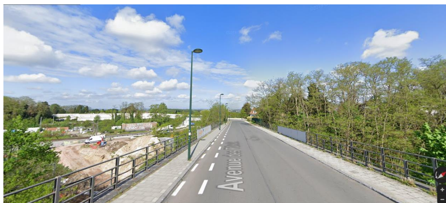
Pont 3 : avenue des Tilleuls : pont-arche enjambant la L26 A-B (voir dossier photos 1 à 4)

Rem : un quatrième pont, plus récent, existe plus loin dans l'avenue des Tilleuls, au croisement avec la rue du Bourdon. Il enjambe la L124, portée à quatre voies. Il n'est pas concerné par la demande.