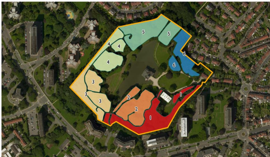
Image 1. Proposition dossier plan de gestion des massifs boisés (gestion forestière)

Le plan de gestion intègre la nécessité de retrouver, au moins de manière partielle, certaines vues dégagées qui ont été perdues et les plantations ad hoc pour maintenir la diversité des essences plantées à l'origine. L'étude comprend de ce point de vue une caractérisation des stations pour vérifier l'adéquation des essences (existantes ou à replanter). Une rapide analyse des vues aériennes depuis 1944 illustre la fermeture progressive des massifs qui a conduit à la perte des perspectives et vues dégagées.