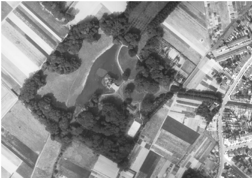
Situation 1953