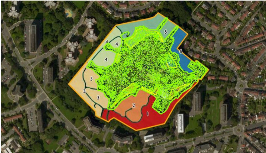
Image 4. Zone de gestion paysagère, intervention coordonnée (gestion forestière et paysagère pour zones adhérentes et zones qui se chevauchent – montage CRMS)