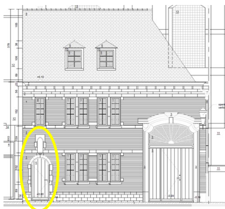
Bestaande toestand: inkomdeur en beeldnis te behouden