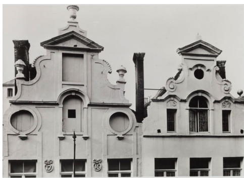
Comité d'Etude du Vieux Bruxelles, 1905

De Commissie vraagt dit aspect dan ook te wijzigen en te opteren voor een kleurschema dat vanuit historische oogpunt coherent is. Ze acht het in dat verband niet aangewezen om naar de oorspronkelijke toestand van 1716 terug te keren omdat deze optie het afbikken zou vergen van het historisch lagenpakket en nog hiaten vertoont. Op basis van het huidige onderzoek en van de gekende historische (iconografische bronnen), lijkt de meest logische en historisch verantwoorde keuze een terugkeer naar de vroeg 20ste-eeuwse toestand, zoals zichtbaar op foto's uit de eerste decennia van de 20 de eeuw: een uniforme lichte tint ( off-white , beige, crème...) voor gevel en schrijnwerk. Het bestaan van deze kleuren werd ook bevestigd door het stratigrafisch onderzoek van 2016 (in verschillende steekproeven werden beige, crème, lichtgrijze... lagen aangetroffen op de derde bepleistering en op het schrijnwerk van de 1 e en 2 e verdieping werden wit-grijze, beige-crème lagen aangetroffen).