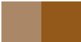
Eerste laag van de derde bepleistering : NCS S 4020 Y30R met boventoon NCSS 4550Y30R

Het stratigrafisch onderzoek heeft de aanwezigheid van 3 pleisterlagen aangetoond alsook van een groot aantal verflagen (ca. 30 tot 35 lagen). De aanvraag stelt voor om het gevelparement een monochrome afwerking te geven in een kleur die teruggrijpt naar de 1ste of 2de afwerkingslaag van de 3de bepleistering. Het betreft ofwel een bruine tint (lichtbruine ondertoon met een donkerbruine boventoon), ofwel een donkergroene beschildering. Op basis van een hypothetische datering van de lagen zouden die kleuren omstreeks het laatste kwart van de 18de eeuw gesitueerd kunnen worden (zie p.8 van het stratigrafisch onderzoek).