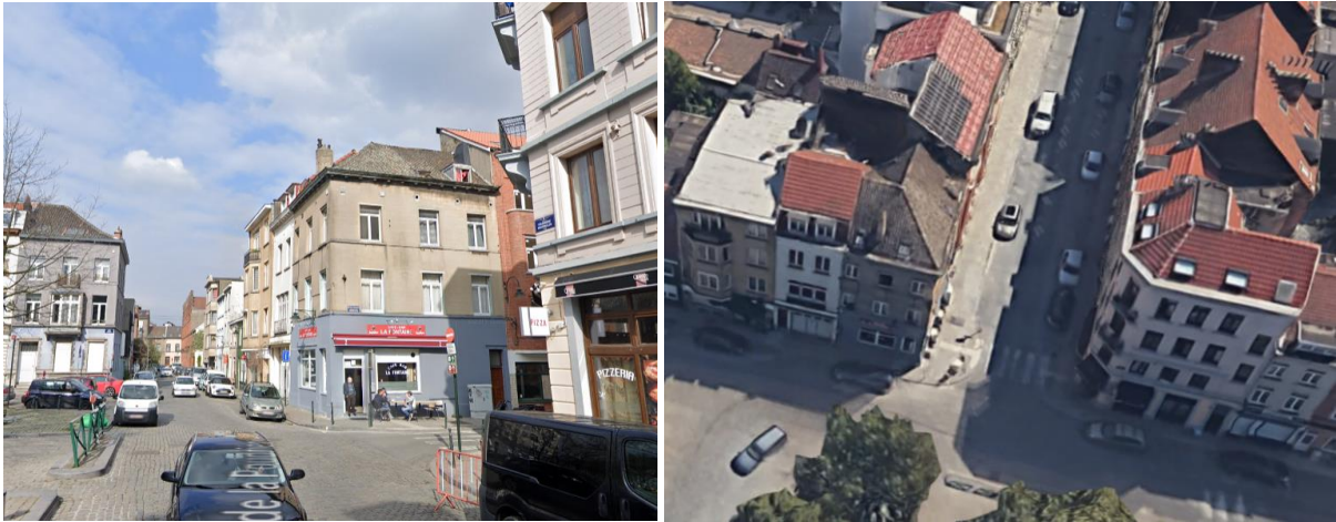
Ci-dessus : la hiérarchie des bâtiments d'angles dans un paysage néoclassique est un élément essentiel. La lucarne sera particulièrement visible et altèrera l'ensemble paysager.

cas, la large lucarne modifierait profondément la toiture et sa hiérarchie avec les maisons voisines. La lucarne serait particulièrement visible vu la localisation et altérerait l'ensemble du paysage néoclassique. La CRMS demande d'opter pour une fenêtre dans la pente de la toiture, de type Velux, compte-tenu de l'impact visuel d'une modification du profil de toiture à cet endroit.