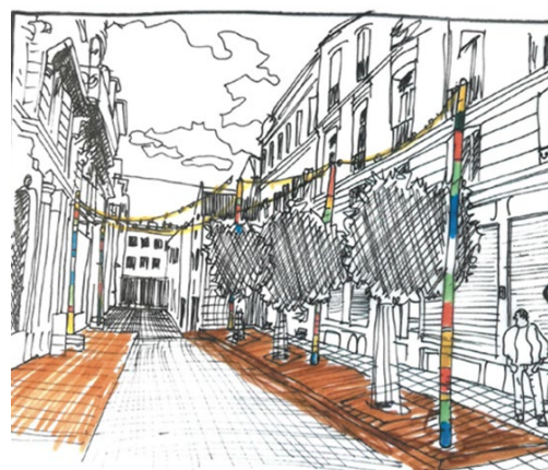
Esquisse simulant le projet (jointe à la demande)