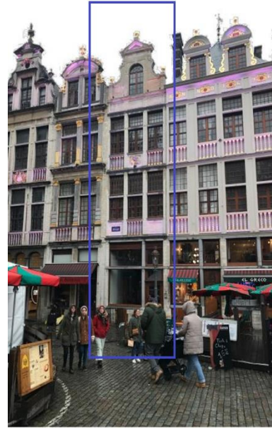
Ci-dessus : La maison « Sainte-Barbe » actuellement. Image tirée du dossier

Issu de la reconstruction qui suivit le bombardement de Bruxelles en 1695, l'immeuble « Sainte-Barbe » répond au plan type des habitations de la Grand-Place : corps principal, cour et bâtiment arrières. Réorganisé au XVII e siècle en deux travées au rez-de-chaussée au lieu des trois existantes encore aux étages, l'immeuble verra plusieurs campagnes de restauration et de restitution d'ornementation, dont celle du bas-relief représentant Sainte-Barbe à la fin du XIX e siècle. Comme bon nombre de maisons de la Grand-Place, son rez-de-chaussée est occupé par un estaminet dès le XIX e - début XX e .