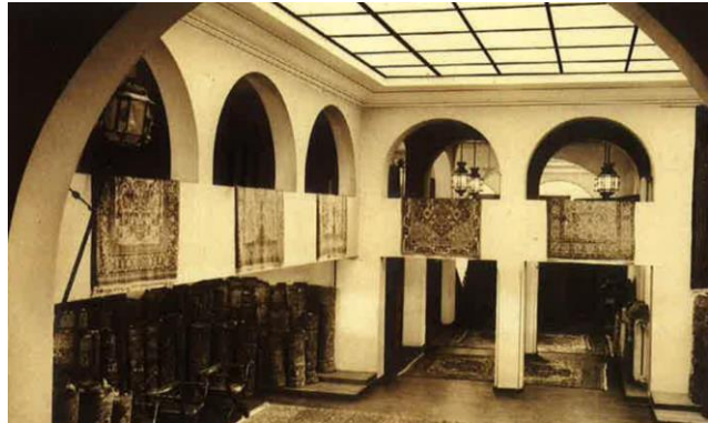
Vue ancienne (1925) du puits de lumière