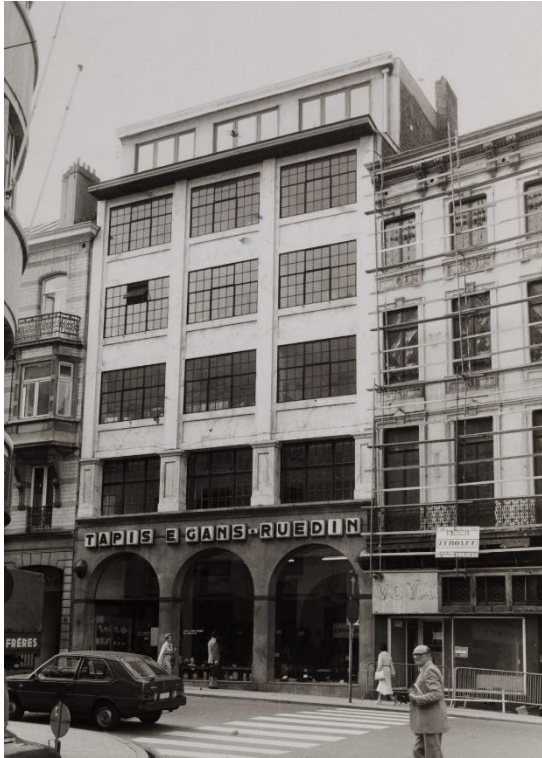
Vue de 1980