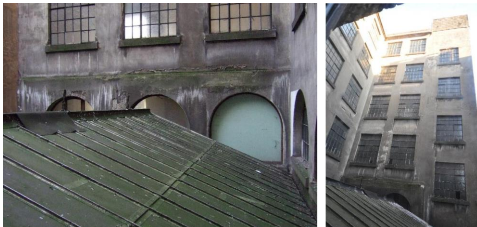
Encombrement visuel de la verrière, devant les fenêtres des appartements rénovés du 1 er étage

La demande consiste à remplacer la verrière en privilégiant des pentes de 7° (au lieu des 21° en place), afin d'aplanir la hauteur totale. La verrière existante serait arasée au niveau de la poutre de ceinture et un nouveau profil de poutre serait établi en béton. L'ossature de la nouvelle verrière serait réalisée en profilés alu (Schüco), et l'entraxe serait adapté, passant de 36,5cm à 69,9cm. Un double vitrage feuilleté (verre translucide feuilleté et double, avec membrane type planitherm évitant les surchauffes) serait installé. Les chéneaux seraient également élargis du côté Ouest, passant de 7cm à 15cm : la