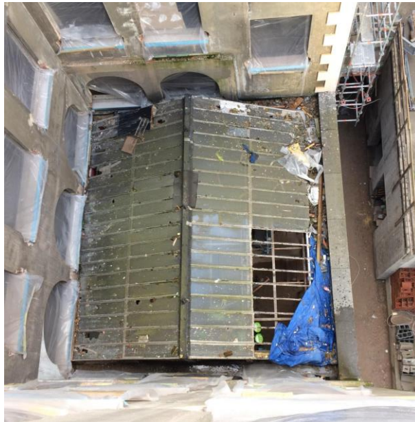
Du côté gauche, chéneau trop étroit