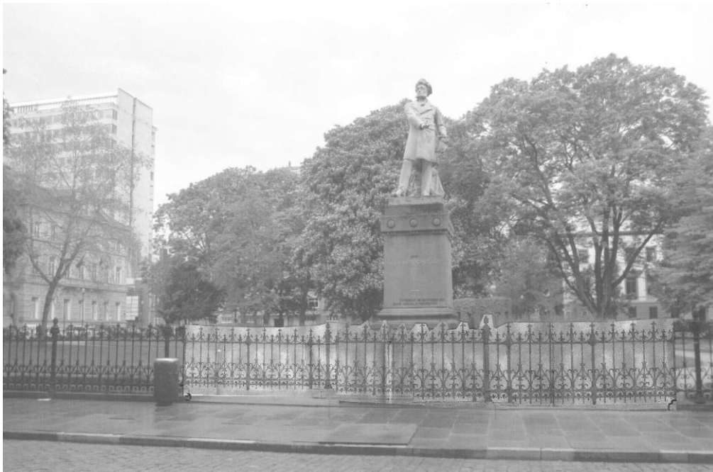
Simulation extraite du dossier

La partie ajoutée serait constituée d'une partie fixe devant le monument et de deux portails ouvrants à double battants symétriquement de part et d'autre de la statue (cf. illustrations ci-dessous). Ces éléments ajoutés reproduiraient à l'identique les éléments décoratifs des grilles existantes. Néanmoins, la distance entre deux colonnes en fonte (de part et d'autre du monument Gendebien) serait d'environ 3 m (et non 2,5 m comme les autres grilles fixes), ce qui implique 7 poteaux intermédiaires et non 6, entraînant une légère dissymétrie. Le soubassement en pierre bleue existant devrait être percé pour fixer les nouvelles grilles.