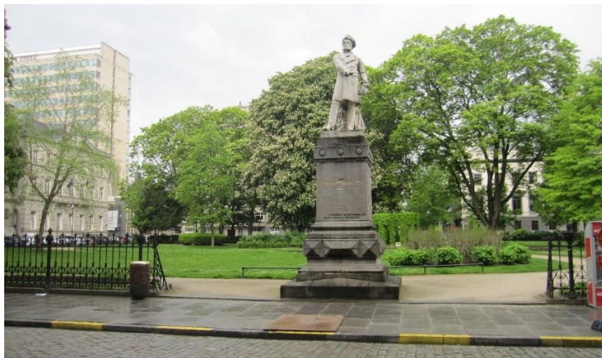
Vue du square entrée rue de la Science avec la statue de Gendebien

Le bien a fait l'objet d'un précédent PU (dispensé d'avis de la CRMS) pour les travaux relatifs à la restauration des grilles du square Frère-Orban (réf. 04/PFU/630942 délivré le 17/08/2017). Ces travaux (restauration à l'identique) sont en cours actuellement et devraient se terminer sous peu sous le suivi régulier de la Ville de Bruxelles et de la DPC.