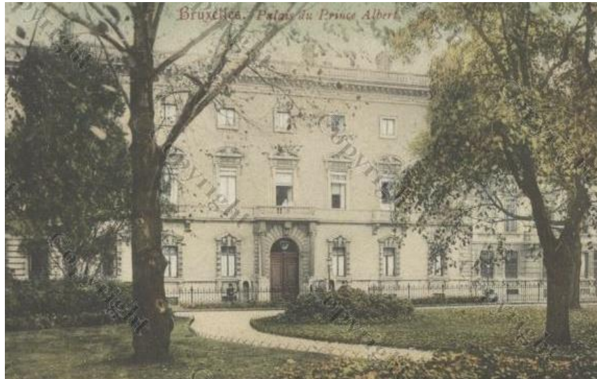
Vue de la grille du square entrée rue de la Science (carte postale 1907)

accessible des quatre côtés de la place. Deux statues ont été ajoutées depuis sa création modifiant les grilles, à savoir le monument de Frère-Orban en 1900 (date à laquelle la place changea de nom) par C. Samuel et celui de Gendebien, juriste et homme politique libéral de la toute jeune Belgique, par C. Van Der Stappen en 1874. Implanté à l'origine place de la Justice puis à la place Gendebien, le monument fut installé en 1957 au square Frère-Orban. Les grilles furent transformées (suppression d'ouvrants) pour offrir un passage plus large. Au centre du square se trouve aussi un monument commémoratif « l'Enclos des treize colonels » de R. Pechère et J.M. Morant.