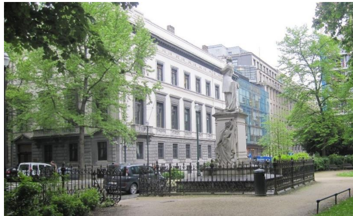
Vue de la grille autour de la statue Frère-Orban

Toutefois, si cette portion supplémentaire de grilles s'intégrerait correctement aux grilles existantes, elle risque de cloisonner le monument et d'en limiter la bonne perception de part et d'autre. Afin de laisser davantage de visibilité et d'espace au monument, une autre option pourrait ainsi être envisagée : celle de contourner la statue à l'instar de ce qui existe au monument Frère-Orban (cf. illustration ci-dessous) au moyen d'une grille basse de part et d'autre de la face avant du socle de la statue et d'une grille haute (identique à celles existantes) sur les trois autres côtés. Des ouvrants pourraient être combinés de part et d'autre de cette formule.