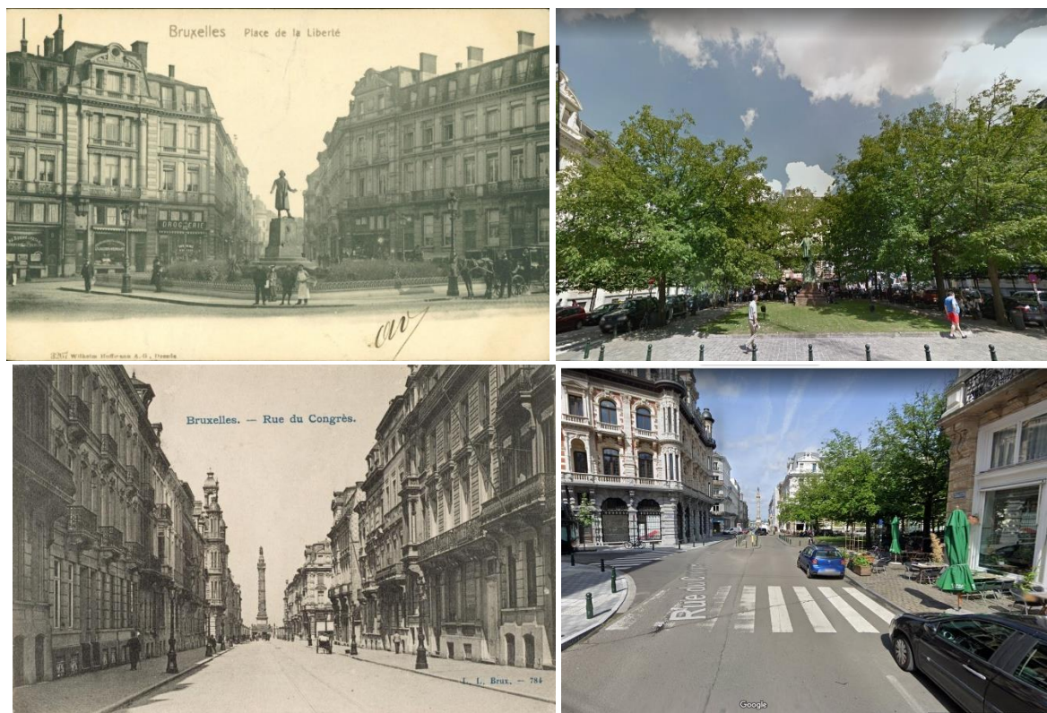
Perspectives sur le square et sur la colonne du Congrès

« Etablie sur le côté Nord de la rue du Congrès, elle ouvre, telle une scène de théâtre représentant un décor urbain, sur quatre rues aisées à appréhender comme espace unitaire (...). L'ensemble de ce paysage forme un espace panoramique complet, offrant de tous côtés des vues étonnantes sur les enfilades de maisons aux façades variées. Il donne une image presque parfaite de la représentation de la ville que les architectes et urbanistes du XIXe siècle cherchaient à mettre en place en même temps qu'ils rebâtissaient des quartiers jugés vétustes » 1