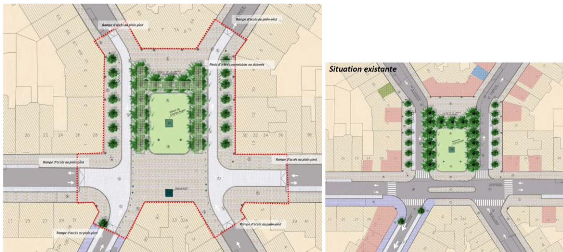
Plan de l'avant-projet et de la situation existante, joints à la demande de principe

La Ville de Bruxelles envisage une requalification de la place de la Liberté dans l'objectif d'améliorer l'accessibilité pour tous les usagers et d'y limiter la circulation automobile en faveur des modes actifs. Les plans d'avant-projet renseignent les options suivantes :