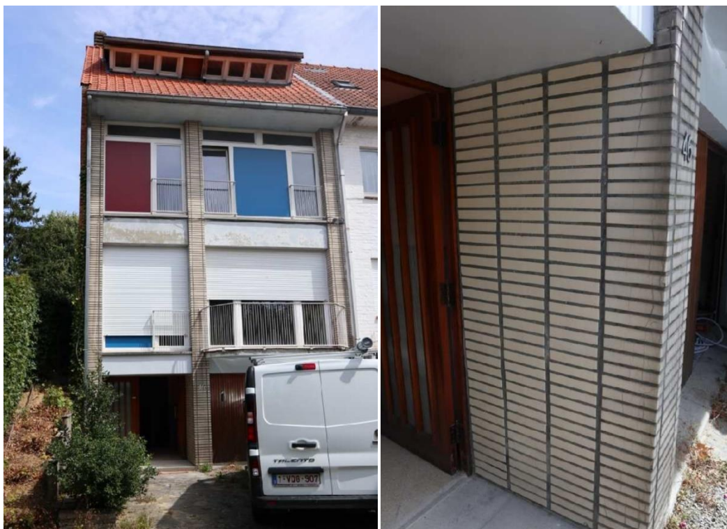
Façade avant et détail du pilier d'entrée (extr. du dossier de demande)