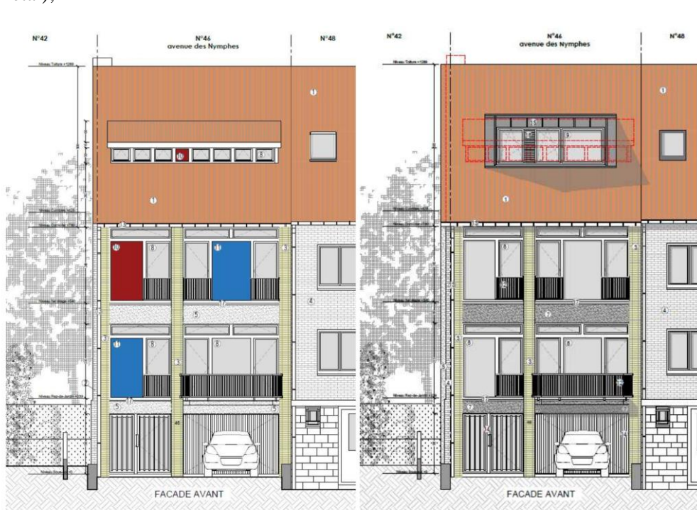
Façade avant - situation existante

des combles en chambre et salle de douche. Il est également prévu de supprimer les cheminées et de créer une nouvelle évacuation pour la cheminée de la chaudière (sortie de toiture en métal);