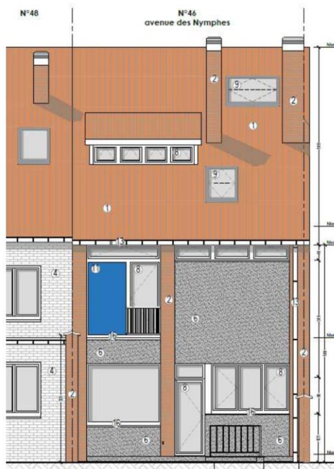
Façade arrière – situation existante