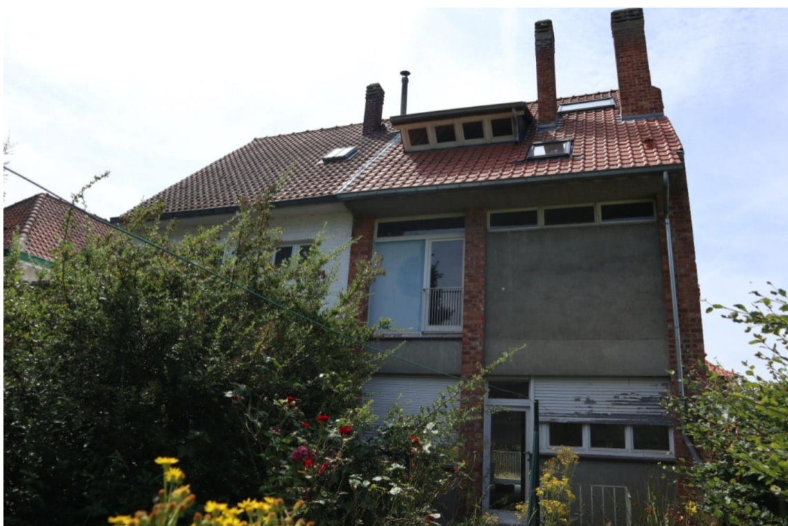
Façade arrière (extr. du dossier de demande)