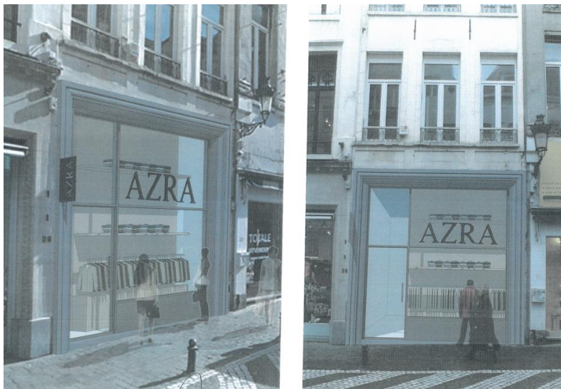
Extraits du dossier

En ce qui concerne l'enseigne parallèle, la CRMS observe que la hauteur de 55 cm prévue pour le lettrage est fortement disproportionnée par rapport à la vitrine. L'enseigne n'est de ce fait pas suffisamment sobre pour être compatible avec le caractère classé de l'immeuble. Elle couvre par ailleurs plus de 5 % de la surface vitrée autorisée par l'article 12 du RCUZ.