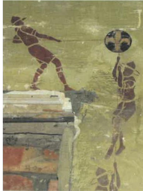
Extr. du dossier de demande