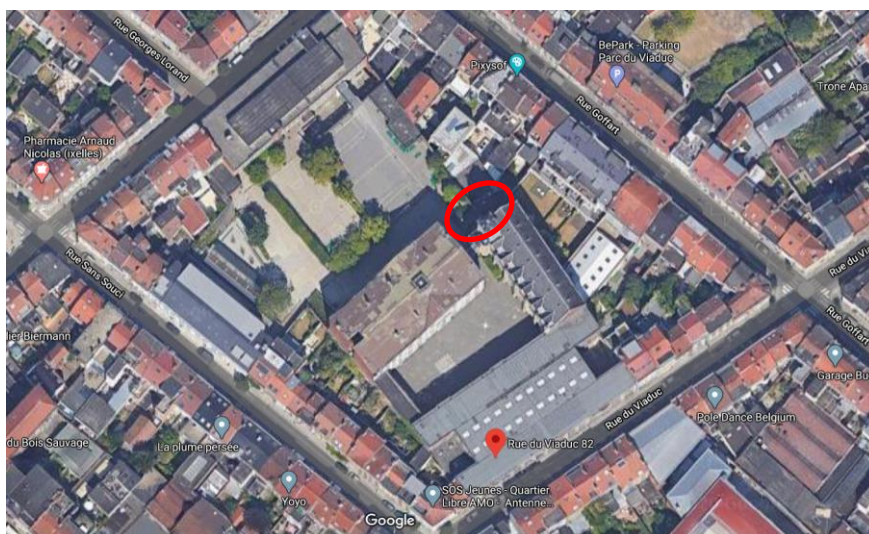
Vue de l'Institut St-Boniface et de l'endroit de la demande

L'Institut Saint-Boniface est fondé en 1862, en tant qu'école primaire par le curé de la paroisse homonyme. En 1911, à l'issue de nombreux déménagements, l'école élit définitivement domicile dans un hospice néoclassique construit en 1854 par les Sœurs de Saint-Vincent de Paul, au centre de l'îlot. Entre 1911 et 1920, le bâtiment fait l'objet d'importantes transformations et le complexe scolaire est considérablement agrandi selon les plans de l'architecte E. Careels. En 1924, une nouvelle aile est mise en chantier. Une aile moderniste a été construite dans les années 1966-67 selon les plans de l'architecte Jean Potvin.