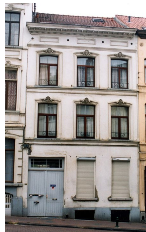
Enfilade néoclassique de la rue de l'Eglise de Saint-Gilles Façade à rue du n°53

La demande porte sur le réaménagement et l'agrandissement du duplex des 3 e et 4 e étages de la maison avec une importante surhausse de la toiture. Pour mémoire, un permis a déjà été délivré pour un premier projet de réaménagement du duplex avec une augmentation du volume de la toiture mais uniquement du côté arrière. Ce premier projet n'a pas été réalisé.