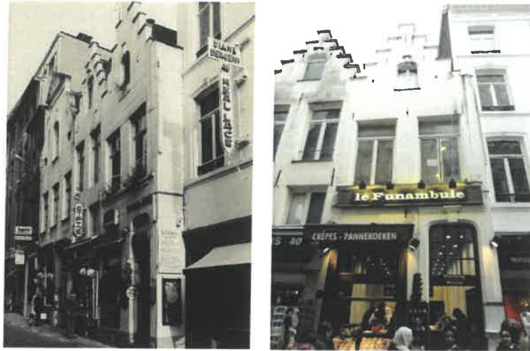
Rue de l'Etuve, 42 - vues en 1980 et actuelle

Actuellement, la maison est affectée au commerce (caves et rez-de-chaussée) et au logement (duplex au R+1 et combles). Vu l'étroitesse de la maison, l'accès unique et les besoins liés au commerce, la demande porte sur la régularisation d'un changement d'affectation, à savoir l'extension du commerce aux étages et la suppression du logement. Le 1 er étage est utilisé par les divers employés comme vestiaire, réfectoire et lieu de repos et un bureau occupe les combles. Il n'y a pas de travaux structurels liés à ce changement d'affectation.