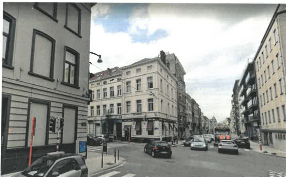
Vue avant travaux

Cet immeuble d'angle fait partie d'un ensemble de style néoclassique de 1876 repris à l'Inventaire du patrimoine architectural, composé de trois maisons identiques (n os 7, 9 et 11, rue Defacqz) et de l'immeuble de rapport situé au croisement des rues de Livourne et Defacqz. Au-dessus d'un rez-de-chaussée commercial à bossages, la façade de 3 travées (rue Defacqz) est, comme ses voisines, marquée d'un balcon axial au 1 er étage. L'entablement est percé de petites baies à arc surbaissé, sous une corniche débordante sur modillons. La façade rue de Livourne compte 4 travées inégales.