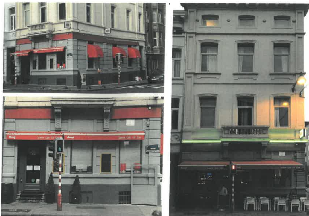
État réalisé (extr. de la demande)

La demande porte sur la régularisation des travaux effectués au rez-de-chaussée : les tentes solaires ont été renouvelées (forme et couleur), le rez-de-chaussée a été repeint (soubassement en gris foncé et élévation en gris moyen), un coupe-vent (repliable) a été ajouté à l'angle, la couleur du bandeau de bois couvrant le dessus des impostes a également été modifiée, et les lettrages supprimés, le néon surplombant le rez-de-chaussée a été changé (de rose en vert).