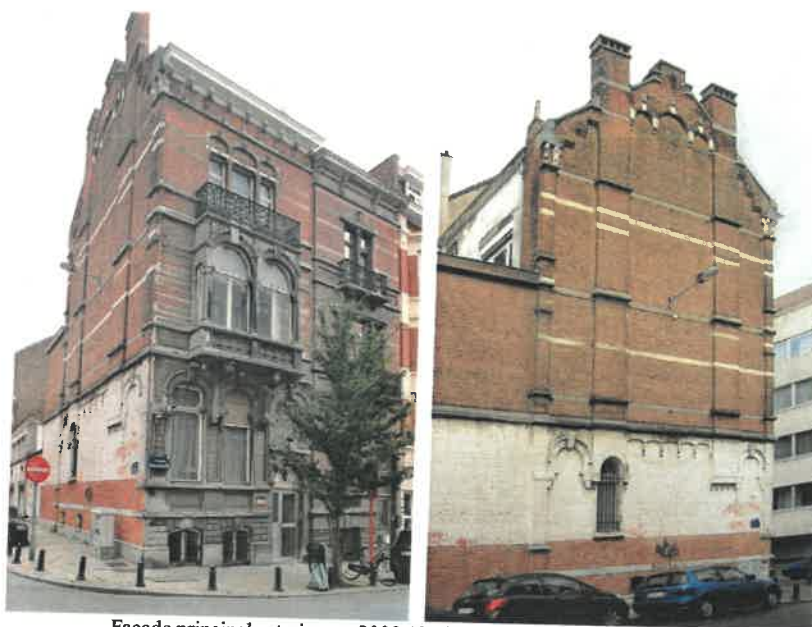
Façade principale et pignon, 2008

Le bien se trouve dans la zone de protection de l'hôtel Solvay sis avenue Louise, 224, classé comme monument, et dans la zone de protection Unesco de ce même immeuble. L'immeuble est aussi repris dans la zone de protection des anciennes écuries et du jardin de l'hôtel Solvay, sis 27, rue Lens. Il se trouve en ZICHEE (PRAS) et l'immeuble est, avec son voisin n°57, inscrit à l'Inventaire du patrimoine architectural de la Région de Bruxelles-Capitale.