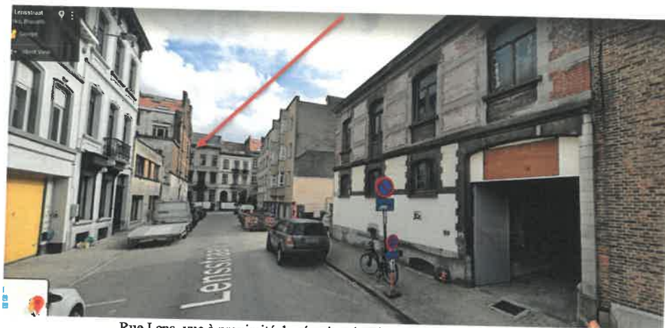
Rue Lens, vue à proximité des écuries classées en 2019

Il s'agit d'un « ensemble de deux maisons de style éclectique, signé et millésimé à hauteur de soubassement du n°57 «L(ucien). Vander Elst – Arch – 1899». Au n°59, élévation sur deux façades en briques rouges très décorative, abondamment rehaussée d'éléments en pierre bleue et blanche. Façade principale vers la rue Dautzenberg: fenêtres du rez-de-chaussée et du premier étage à arc outrepassé surlignées d'archivoltes. Le premier étage est marqué par une loquette en pierre de plan rectangulaire surmontée d'un balcon ceint d'un garde-corps en ferronnerie sur lequel s'ouvre un triplet. Menuiserie et ferronnerie partiellement conservées. Façade latérale vers la rue Lens: percée d'une seule petite fenêtre grillagée au rez-de-chaussée. Cheminées formant pilastres, arcs outrepassés et frises d'arceaux décoratifs. » (extr. de Irismonument)