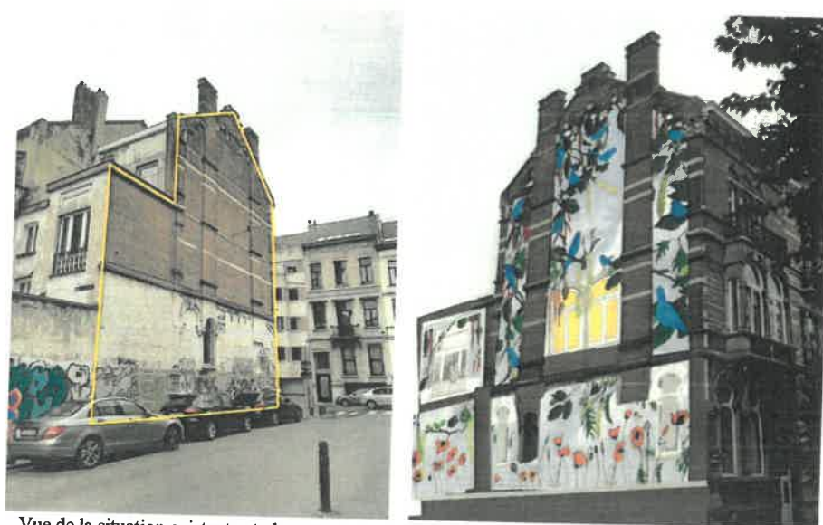
Vue de la situation existante et photomontage de la situation projetée (extr. de la demande de permis)