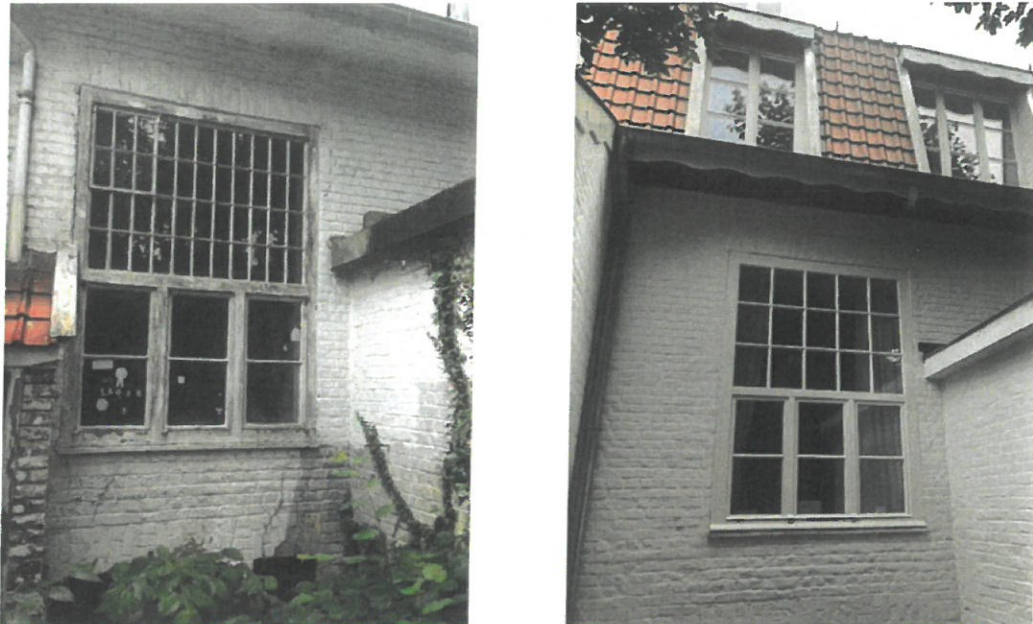
Fig. 3. Exemple du châssis 1 : situation originelle (à gauche) et situation existante (à droite). Illustration issue du dossier de demande.

La Commission regrette la disparition des châssis authentiques en acier mais surtout leur remplacement par des exemplaires ne respectant pas les divisions d'origine car ce genre de composition participe pleinement à la qualité patrimoniale de ce type de villa pittoresque, d'autant que Joseph Diongre, l'architecte des « Charmettes », apportait un soin particulier à la conception des détails de ses constructions.