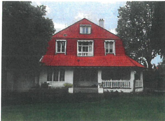
Fig. 1. Façade arrière de la villa "Les Charmettes". Illustration issue du dossier de demande.

Le caractère pittoresque de l'habitation connue comme « Les Charmettes » est notamment conféré par l'imposante toiture en tuiles de Pottelberg, les terrasses et différents détails décoratifs (garde-corps ouvragés, rives festonnées, bow-window, etc.).