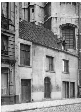
Archiefoto 1940

Concreet vraagt de Commissie om op de winkelpuien van beide gevels te renoveren volgens de compositie die men kan aflezen op de plannen van 1946, zonder de afmetingen van de gevelopeningen te wijzigen of de bovenlichten dicht te maken (zie de bijgevoegde archiefoto waarop een deel van het huis nr. 4 te zien is). De puin moeten voorzien worden van natuurstenen penanten en van kwalitatief schrijnwerk met een gepaste onderverdeling en fijne profielen. Bijkomend vraagt de Commissie om geen LED-panelen op de gevel te plaatsen omwille van hun negatieve visuele impact en de brievenbussen beter in de gevels te integreren.