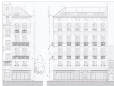
Inplanting ; foto van de bestaande toestand en ontwerp (documenten gevoegd bij de aanvraag)

De aanvraag betreft het pand op de hoek van de Anspachlaan met de Olivetenhof dat is gelegen in de vrijwaringszone van de Apotheek van den Bijstand aan de Anspachlaan 160, waarvan de winkelpui en het interieur als monument beschermd zijn . Het hoekhuis bevindt zich tevens in de onmiddellijke omgeving van de beschermde Onze-Lieve-Vrouw van Goede Bijstand kerk.