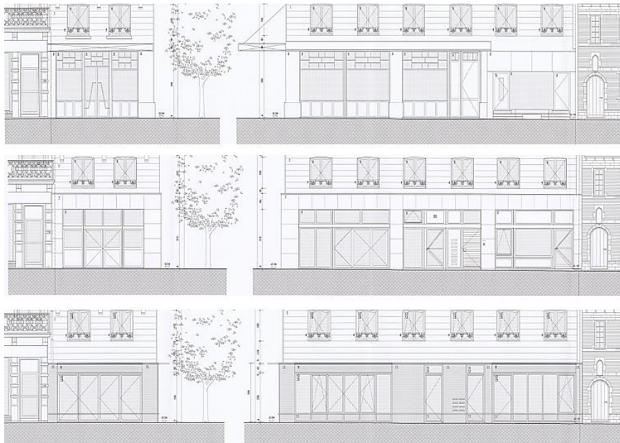
Opstanden van de winkelpui: van boven naar onder plannen van de rechtstoestand van 1946, de bestaande toestand en het ontwerp – documenten uit het aanvraagdossier