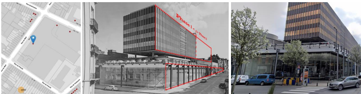
Contexte patrimonial, photo d'archive du bâtiment de Stapels (extr. du dossier de demande) et vue actuelle

En réponse à votre courrier du 08/09/2023, nous vous communiquons l'avis conforme favorable sous condition émis par notre Assemblée en sa séance du 27/09/2023, concernant la demande sous rubrique.