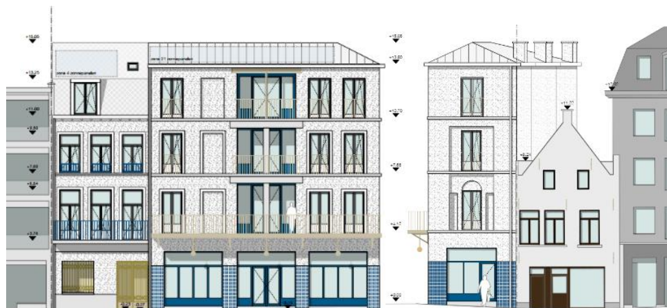
Gevelontwerp gevoegd bij de aanvraag

Het ontwerp voorziet onder meer volgende ingrepen: