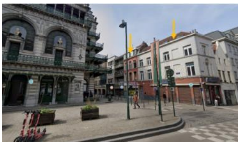
Inplanting van het ontwerp

De aanvraag betreft de volledige renovatie van twee huizen aan de Hooikaai 1-3 en 5, gelegen in de vrijwaringszone van de Vanhoetegang die uitgaat op de Hooikaai 15. Het neoclassicistisch hoekhuis op nr. 1-3 dat dateert van rond 1831 staat bovendien ingeschreven op de Inventaris van het bouwkundig erfgoed.