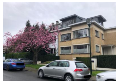
État actuel de la façade (photo jointe à la demande)

Selon la CRMS, les interventions n'auront pas d'impact visuel négatif sur les perspectives vers et depuis la maison Eggericx, dont la zone de protection englobe le bien et qui est située à l'arrière de la maison concernée.