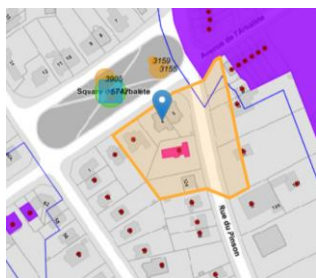
Localisation de la façade concernée et du bien classé

En réponse à votre courrier du 09/10/2023, reçu le 12/10/2023, nous vous communiquons l'avis formulées par notre Assemblée en sa séance du 18/10/2023.