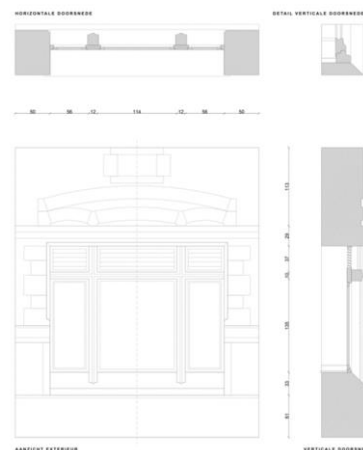
Detail nieuw houten raam – uit het aanvraagdossier

Daarenboven wenst men tegemoet te komen aan de problematiek van de ventilatie van de refter. Aangezien een centraal ventilatiesysteem een te ingrijpende verbouwing van het interieur zou vergen, opteert men voor een decentraal systeem om de refter van een voldoende groot debiet aan verse lucht moet voorzien. Dit systeem vergt echter de plaatsing van een ventilatie-unit per raamopening met rechtstreekse aan- en afvoer van lucht en dus van een ventilatierooster de imposten van de ramen. Deze roosters onttrekken de achterliggende units ook aan het zicht en worden eveneens in hout uitgevoerd en zoals de rest van het raam witgelakt.