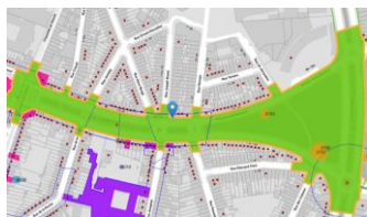
Localisation patrimoniale,