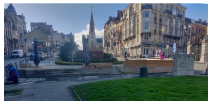
État existant (photo jointe à la demande)

La demande vise à régulariser le socle en bois de la terrasse qui occupe le rond-point de l'avenue Louis Bertrand , classée comme site, avec les rues Kessels, Josaphat, Joseph Brand et Herman.