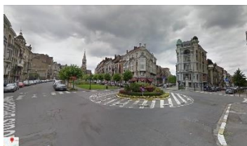
Rond-point concerné en 2014