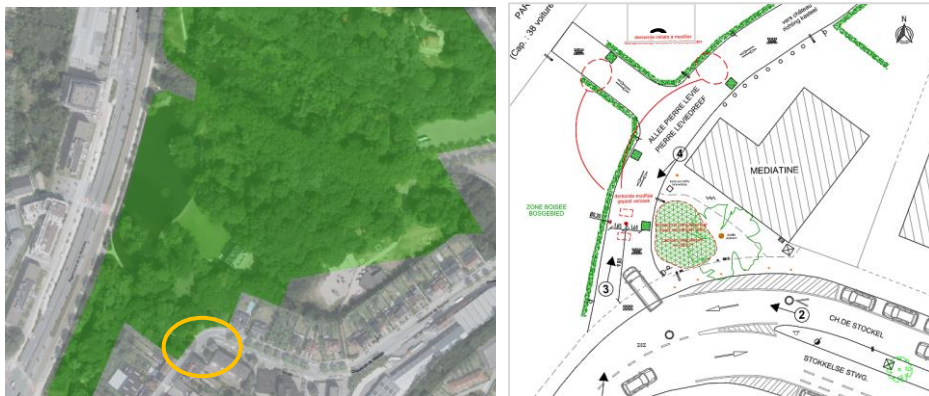
Localisation de la zone d'intervention dans le site classé et plan joint à la demande

La demande s'inscrit dans le projet d'intégrer à plusieurs endroits du site classé formé par le massif boisé du Château Malou des dispositifs pour encadrer la circulation et le stationnement automobiles et cyclistes.