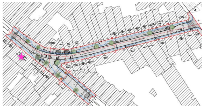
Axonométrie et plan de la situation projetée, joints à la demande