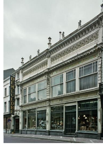
Vues de la chaussée de Wavre en direction de la rue Goffart et immeuble Demeuldre-Coché

En particulier, la suppression du trottoir surélevé devant l'immeuble classé Demeuldre-Coché constitue une atteinte à la cohérence de l'espace public. Comme dans tout paysage historique néoclassique, cet élément joue à cet endroit un rôle visuel important en reliant la façade à la voirie, mettant ainsi l'immeuble classé en valeur. Sur le plan patrimonial, cette perte de cohérence entre la voirie et le bâti représente un appauvrissement regrettable.