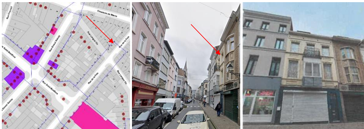
Contexte patrimonial – Vue d'ensemble dans la rue de la Paix et vue du n°44 (extr. du dossier de demande)

En réponse à votre courrier du 22/12/2023, reçu le 03/01/2024, nous vous communiquons l'avis émis par la CRMS en sa séance du 10/01/2024, concernant la demande sous rubrique.