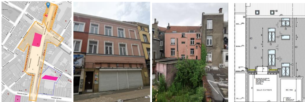
A gauche, extrait Brugis. Au centre, vues des façades avant et arrière. A droite, projet de la façade arrière (extraits du dossier)

En réponse à votre courrier du 22/12/2023, nous vous communiquons l'avis émis par la CRMS en sa séance du 10/01/2024, concernant la demande sous rubrique.