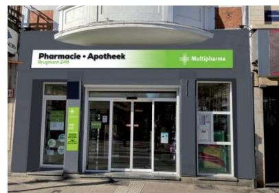
Bestaande en ontworpen toeste-and (foto(montage) uit het aanvraagdossier

De aanvraag heeft geen ongunstige impact op de zichten van en naar het nabijgelegen beschermde goed. De KCML vraagt de stedenbouwkundige voorschriften inzake uithangborden strikt toe te passen. Ze vraagt ook het evenwijdige uithangbord te beperken tot de eigenlijke pui (niet plaatsen boven de toegangsdeur tot de verdiepingen) en de gevel niet donkergrijs te schilderen op de begane grond. De witte tint dient behouden aangezien die beter past bij de overige gevelmaterialen.