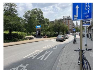
Photomontage à la porte de Hal joint à la demande

La CRMS émet un avis défavorable sur la demande. Elle considère que le dispositif proposé sur le parvis Saint-Gilles participe à l'encombrement de l'espace public aux abords de l'église Saint-Gilles et portera atteinte aux perspectives vers et depuis l'église et les autres classés situés à proximité.