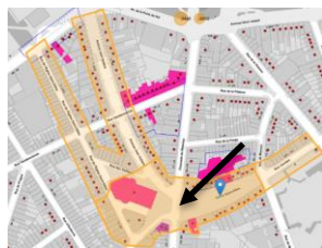
Localisation du projet au Parvis St-Gilles

En réponse à votre courrier du 22/01/2024, nous vous communiquons l'avis émis par la CRMS en sa séance du 31/01/2024, concernant la demande sous rubrique.