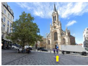
Perspective vers l'église classée (© Google Streetview, annoté par la CRMS)