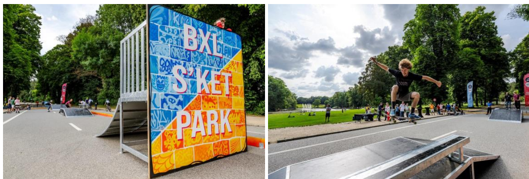
Le skatepark en été 2023 (extraits du dossier)

Ancienne avancée de la forêt de Soignes, le Bois de la Cambre a été aménagé en parc public paysager dès 1862 par le paysagiste allemand Edouard Keilig. Il est classé par arrêté royal du 18/11/1976.