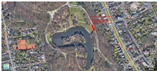
Localisation du skatepark dans le Bois de la Cambre (extrait du dossier)

En réponse à votre courrier du 30/01/2024, nous vous communiquons l'avis conforme favorable sous conditions émis par notre Assemblée en sa séance du 21/02/2024, concernant la demande sous rubrique.