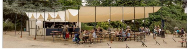
Vue de la guinguette installée lors d'une édition précédente. Image extraite du dossier.