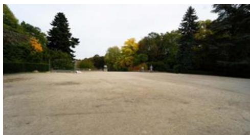
Vue de la localisation de la guinguette.

L'arrêté royal du 26 octobre 1973 classe comme site l'ensemble du parc Duden à Forest.