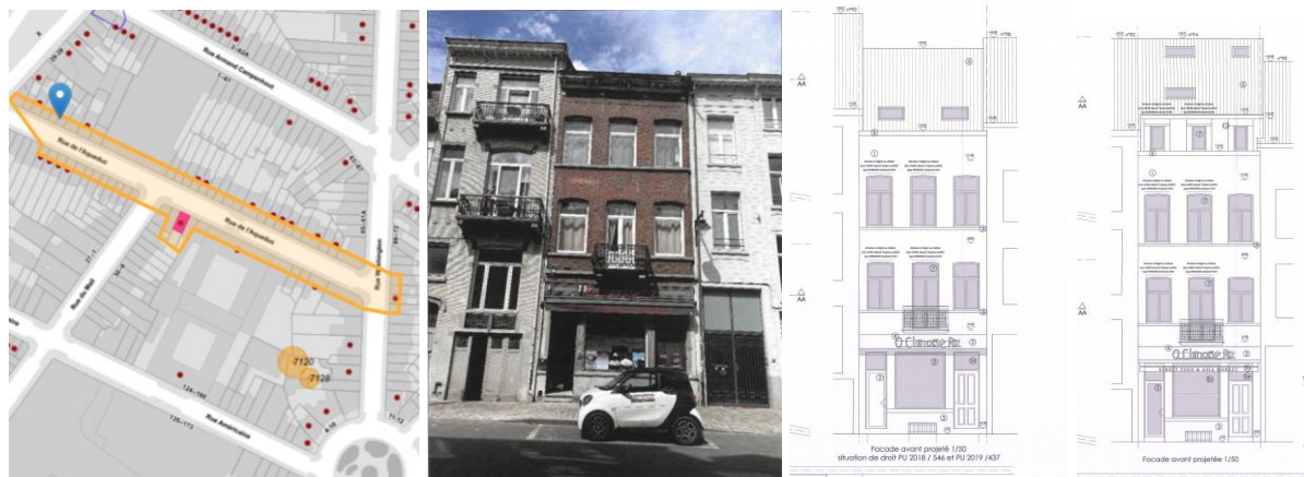
De gauche à droite, extrait Urbis, vue actuelle de la façade à rue, situations existante et projetée de la façade avant (extraits du dossier)

En réponse à votre courrier du 08/02/2024, reçu le 09/02/2024, nous vous communiquons l'avis émis par la CRMS en sa séance du 21/02/2024, concernant la demande sous rubrique.