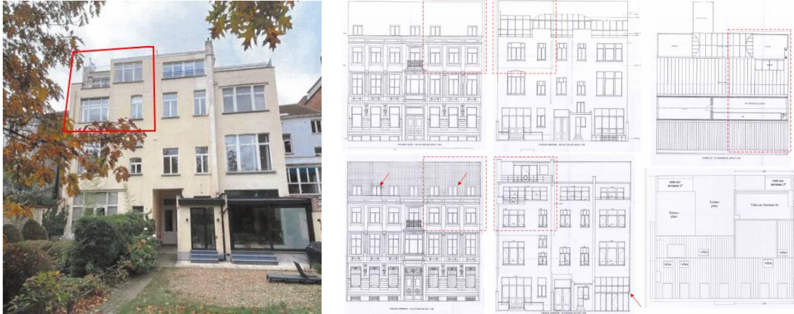
Partie du bien à régulariser (documents extraits du dossier de demande)

La demande actuelle consiste à régulariser un appartement aménagé en triplex aux 2 e , 3 e et 4 e niveaux du bâtiment, à régulariser une lucarne ajoutée en façade avant du bien (en symétrie avec les lucarnes prévues par la situation de droit), et à régulariser des modifications apportées en toiture arrière, comportant notamment la création d'un volume au +4 et l'aménagement d'une terrasse donnant sur l'intérieur de l'îlot protégé.