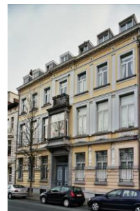
Contexte patrimonial (© BruGIS) ; Vue aérienne du bien (entouré en rouge) et de la maison classée (© Bing Maps) ; Façade avant du bâtiment (Inventaire du patrimoine architectural)