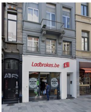
Vue de la façade concernée par la demande