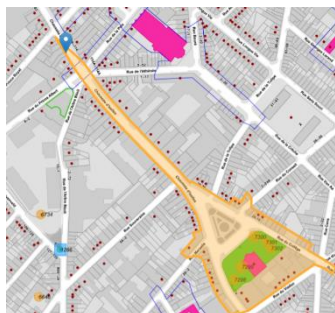
Contexte patrimonial

En réponse à votre courrier du 30/01/2024, reçu le 31/01/2024, nous vous communiquons l'avis émis par la CRMS en sa séance du 21/02/2024, concernant la demande sous rubrique.