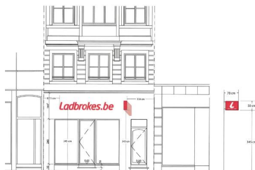
Plan de l'enseigne à régulariser (document extrait du dossier de demande)