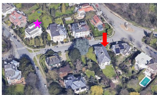
Vue aérienne. En mauve : la Maison Genicot, en rouge l'immeuble concerné.