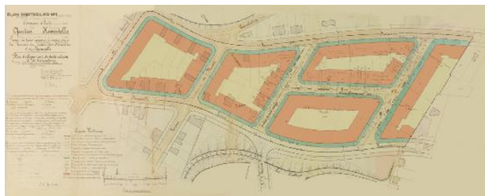
PPA n°5 - 'Quartier Kamerdelle'.