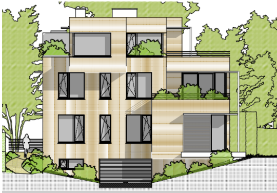
Élévation nord – projet de mai 2023

La présente demande est une modification à la demande de permis initiale. Les matérialités extérieures des façades ont été revues (de bardages en bois verticaux et horizontaux, vers des briques de parement de couleurs grises), les dispositions des baies ont été modifiées et le gabarit a été réduit en diminuant le volume au niveau +2