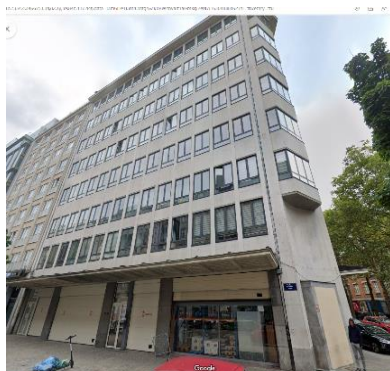
Façade existante.

En réponse à votre courrier du 29/02/2024, reçu le 04/03/2024, nous vous communiquons l'avis émis par la CRMS en sa séance du 13/03/2024, concernant la demande sous rubrique.