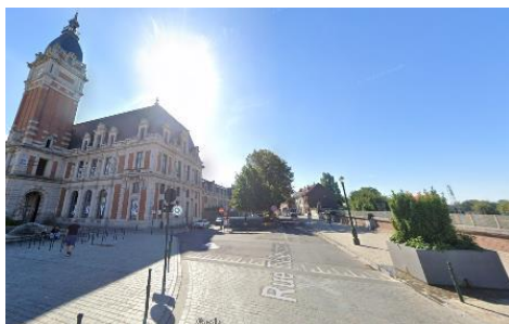
Bestaande situatie.

In antwoord op uw brief van 20/02/2024, sturen wij u het advies dat onze Commissie over bovengenoemd onderwerp uitgebracht heeft tijdens haar vergadering van 13/03/2024.