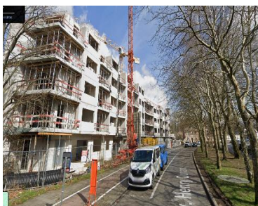
Photo de la façade avant en cours de construction

En réponse à votre courrier du 27/02/2024, nous vous communiquons l'avis émis par la CRMS en sa séance du 13/03/2024, concernant la demande sous rubrique.