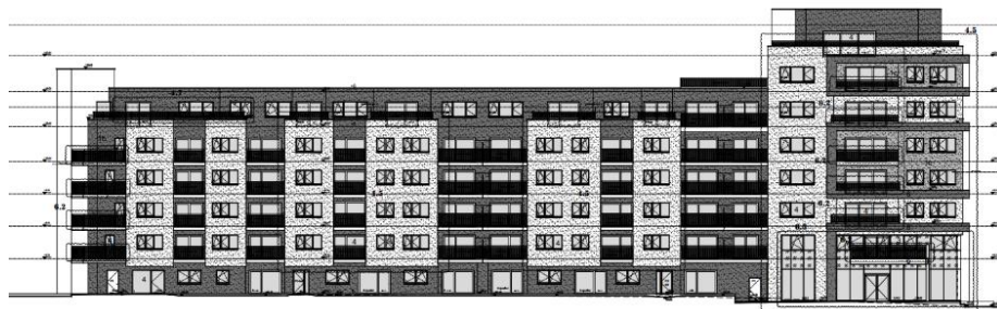
Situation projetée. Image extraite du dossier de demande