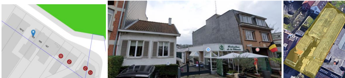
De gauche à droite, extrait Brugis, vue de la maison et son commerce à rue et vue aérienne avec les serres

En réponse à votre courrier du 01/03/2024, reçu le 06/03/2024, nous vous communiquons l'avis émis par la CRMS en sa séance du 13 mars 2024, concernant la demande sous rubrique.