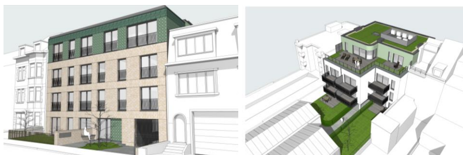
Elévation avant et axonométrie projetées (extraits du dossier)

Le projet vise la démolition d'une petite maison unifamiliale datant de 1932 et du commerce attenant (jardinerie) situés directement en face du site classé du Kauwberg (zone de protection). A leur emplacement, un nouvel immeuble de neuf appartements (R+3+T plate) serait construit avec neuf emplacements de parking en sous-sol. La parcelle est reprise en zone d'habitation à prédominance résidentielle au PRAS. A l'arrière, une partie des serres datant des années 50-60 serait maintenue pour d'éventuelles nouvelles activités productives.