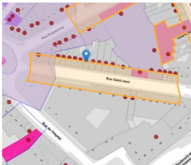
Localisation du projet

En réponse à votre courrier du 03/04/2024, nous vous communiquons l'avis émis par la CRMS en sa séance du 24/04/2024, concernant la demande sous rubrique.