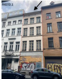
Photo du bien concerné, extraite de la demande