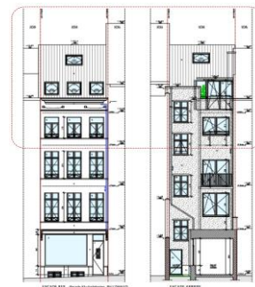
Plans d'élevation de la situation projetée, extraits de la demande

Selon la CRMS, les travaux consignés dans la demande n'auront pas d'impact visuel négatif sur le bien classé situé à proximité et n'appellent pas de remarques d'ordre patrimonial. Les transformations intérieures et celles proposées en façade arrière relèvent d'un examen urbanistique plutôt que patrimonial ; la CRMS ne s'est dès lors pas prononcée à ce sujet.