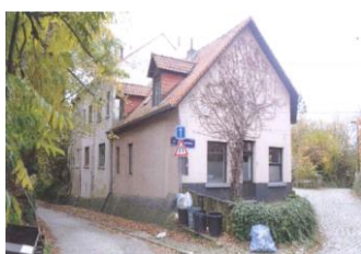
Bien concerné par la demande (photo extraite de la demande)