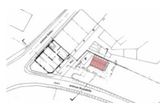
Plans de l'implantation existante et projetée, extraits de la demande

Selon la CRMS, la maison d'angle dans son état actuel n'a pas d'impact visuel négatif sur les perspectives vers et depuis les biens classés situés à proximité. La demande de régularisation n'appelle donc pas de remarques d'ordre patrimonial.