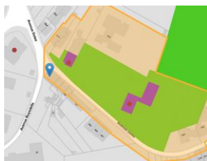
Localisation du projet

En réponse à votre courrier du 11/04/2024, reçu le 15/04/2024, nous vous communiquons l'avis émis par la CRMS en sa séance du 24/04/2024, concernant la demande sous rubrique.